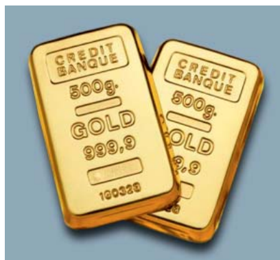
Tisíce Čechů se během posledních dvou let vrhly na nákup žlutého kovu.